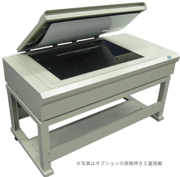
※写真はオプションの原稿押さえ蓋搭載