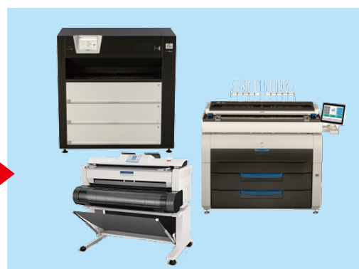
KIP 製プリンターへダイレクトコピーが可能