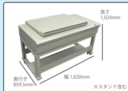
※写真はオプションの原稿押さえ蓋搭載

専用コピーソフト標準搭載で KIP プリンターへのコピーはダイレクトに行えます。 面倒な操作の必要がない事は生産性向上につながります。